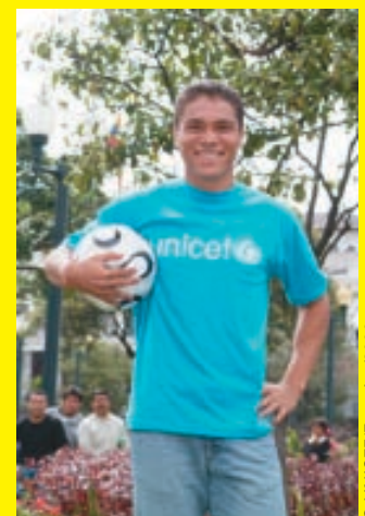
Edwin Tenorio es uno de los futbolistas más famosos de Ecuador.

No es la primera vez que Tenorio apoya los esfuerzos de UNICEF a favor de la infancia. El jugador y algunos de sus compañeros de la selección nacional ecuatoriana grabaron una serie de anuncios de promoción de la campaña de UNICEF sobre el acceso a la educación para todos. Tenorio también apoya a una organización no gubernamental que trabaja para proteger el ambiente en la provincia de Esmeraldas, donde nació.