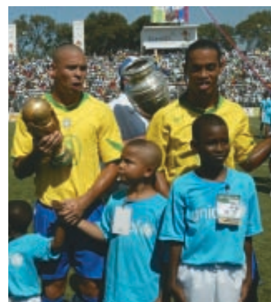
Un Partido por la Paz en Puerto Príncipe, Haití, 2004.