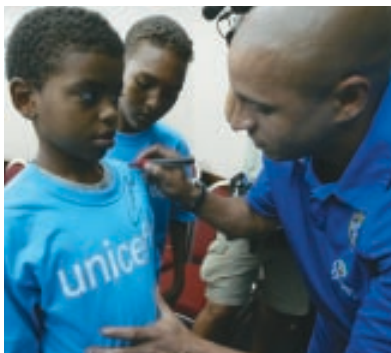
El jugador brasileño Roberto Carlos firma la camiseta de un niño durante un partido de práctica en República Dominicana.

El deporte, como lenguaje universal, también puede ser un poderoso vehículo de promoción de la paz, la tolerancia y la comprensión. Mediante su poder de reunir personas a través de fronteras, culturas y religiones, puede promover la reconciliación, reducir tensiones y generar diálogo.