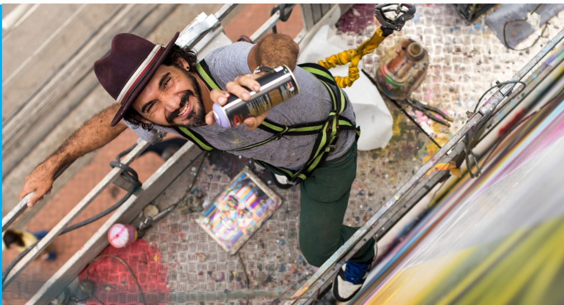
Eduardo Kobra Artista Urbano

“ Tengo mucho orgullo de mi historia en la periferia y luché por todo, fácil no fue ”