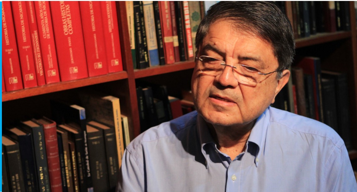
Sergio Ramírez Escritor

“ Hay que corregir los grandes abismos sociales que existen en una redistribución de la riqueza para que los recursos vayan a dar a la educación. ”