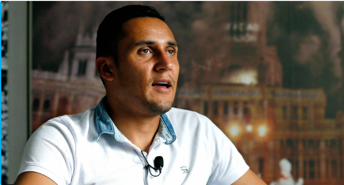
Keylor Navas Futbolista

“ No hay nada más injusto en la vida que un niño esté condenado a la pobreza y la discriminación desde que nace. ”