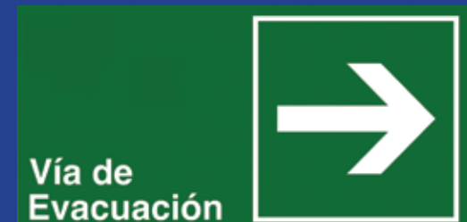
Vía de Evacuación