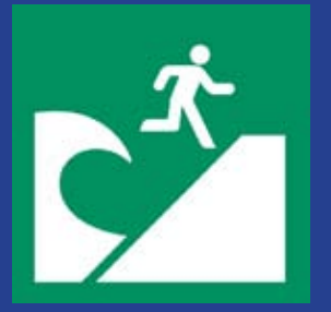
ZONA DE EVACUACIÓN DE TSUNAMI