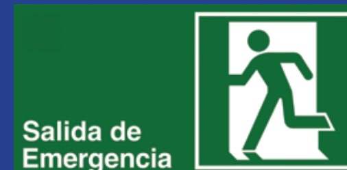
Salida de Emergencia