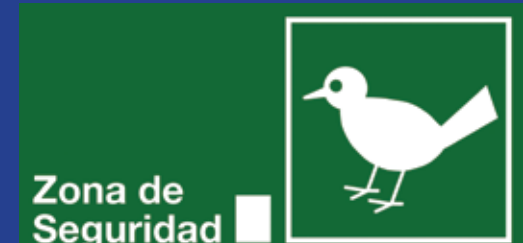
Zona de Seguridad

IMPORTANTE EN CASO DE EMERGENCIA NO GRITES NO CORRAS NO EMPUJES Actúa con calma y prudencia para evitar accidentes.