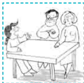
C. Estilo democrático