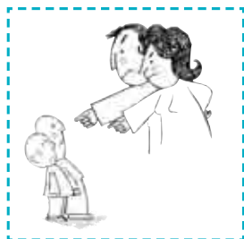
A. Estilo autoritario