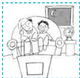
B. Estilo horizontal